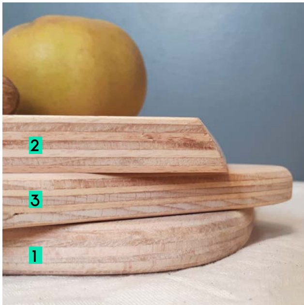
Planche en contre-plaqué hêtre (alimentaire) Dimensions 220x300 mm